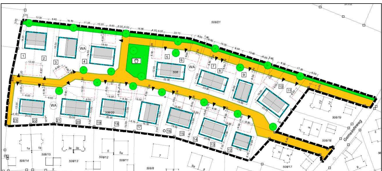
Bebauungsplan „Talfeld-Nord“, Großdingharting, Fassung vom 19.12.2019

Die Realisierung des Baugebietes soll in mehreren Abschnitten erfolgen, so dass das Verfahren nach § 3 Abs. 2 BauGB und § 4 Abs. 2 BauGB nun für den südöstlichen Planungsriff durchgeführt wird. Dabei wurden die Ergebnisse der Abwägung zu den im Rahmen des Verfahrens nach § 3 Abs. 1 BauGB und § 4 Abs. 1 BauGB eingegangenen Stellungnahmen berücksichtigt.